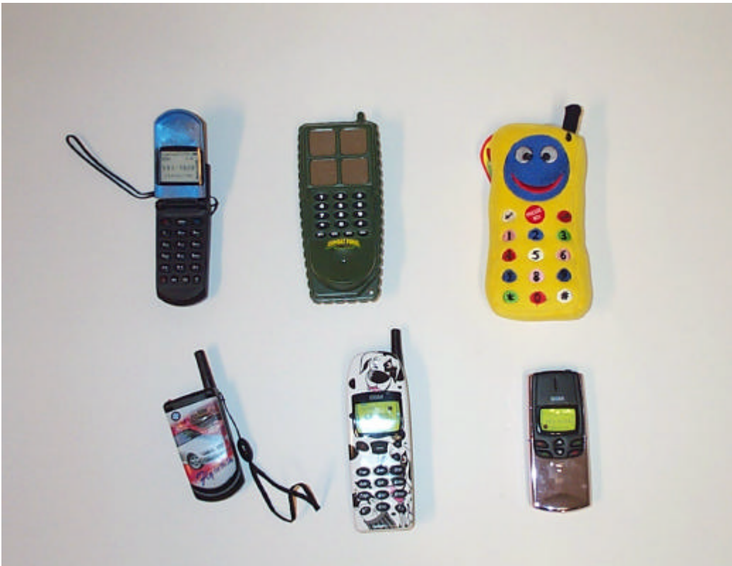
6 underkända leksakstelefoner

Ändå är resultatet att betrakta som en förbättring jämfört med en tidigare marknadskontroll som genomfördes 1994. Då var det endast 3 av 42 testade telefoner som uppfyllde det nu gällande ljudkravet 80 dB vid örat. Det är tydligt att det är fullt möjligt att producera leksakstelefoner med en ljudnivå som inte är skadlig för små barn.